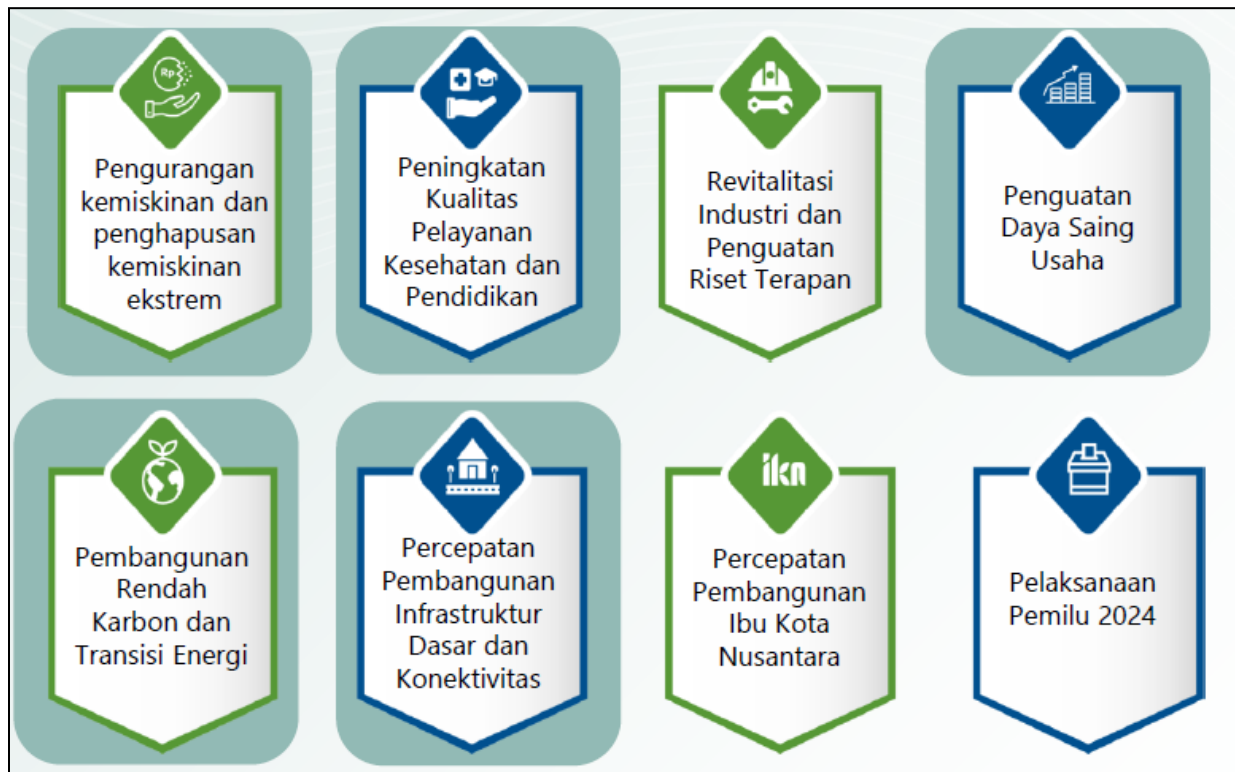
Gambar 3.1 Arah Kebijakan RKP Tahun 2024

Pada Tahun 2024, Tema Pembangunan Nasional yang ditetapkan dalam RKP Tahun 2024 adalah "Mempercepat Transformasi Ekonomi yang Inklusif dan Berkelanjutan" dengan 8 arah kebijakan sebagai berikut: